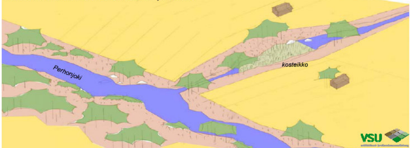
Kuva: Kosteikko on mahdollista rakentaa maisemaan hyvin istuvaksi.

Lisätietoja: Perhon kunta, Tekninen johtaja Tapio Alanko, puh. (06) 888 3111